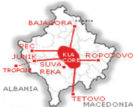
Келии на Ал Каеда во Косово, Албанија и Македонија

меѓународен фонд за помош, 9 6. Глобална фондација за помош, 10 7. Друштво за оживување на исламското наследство 11 и 8. Калири Ил Мерилис „повеќе добрина“. Овие организации претставуваат основна база за оперирање на Ал Каеда на Косово. За јавноста, организацијата се занимава со образование и пружа медицинска помош на луѓето во Косово, а во реалноста организацијата им плаќа на луѓето да го следат исламот. Најголемиот дел на нивните активности е промоција на исламското фундаменталистичко убедување и финансирање на исламските радикали со помош на хуманитарни донации. Најважна логистичка база на исламскиот екстремизам се новоизградените џамии во кои се проповеда вехабизам или со други зборови идеологија на милитантен ислам. 12